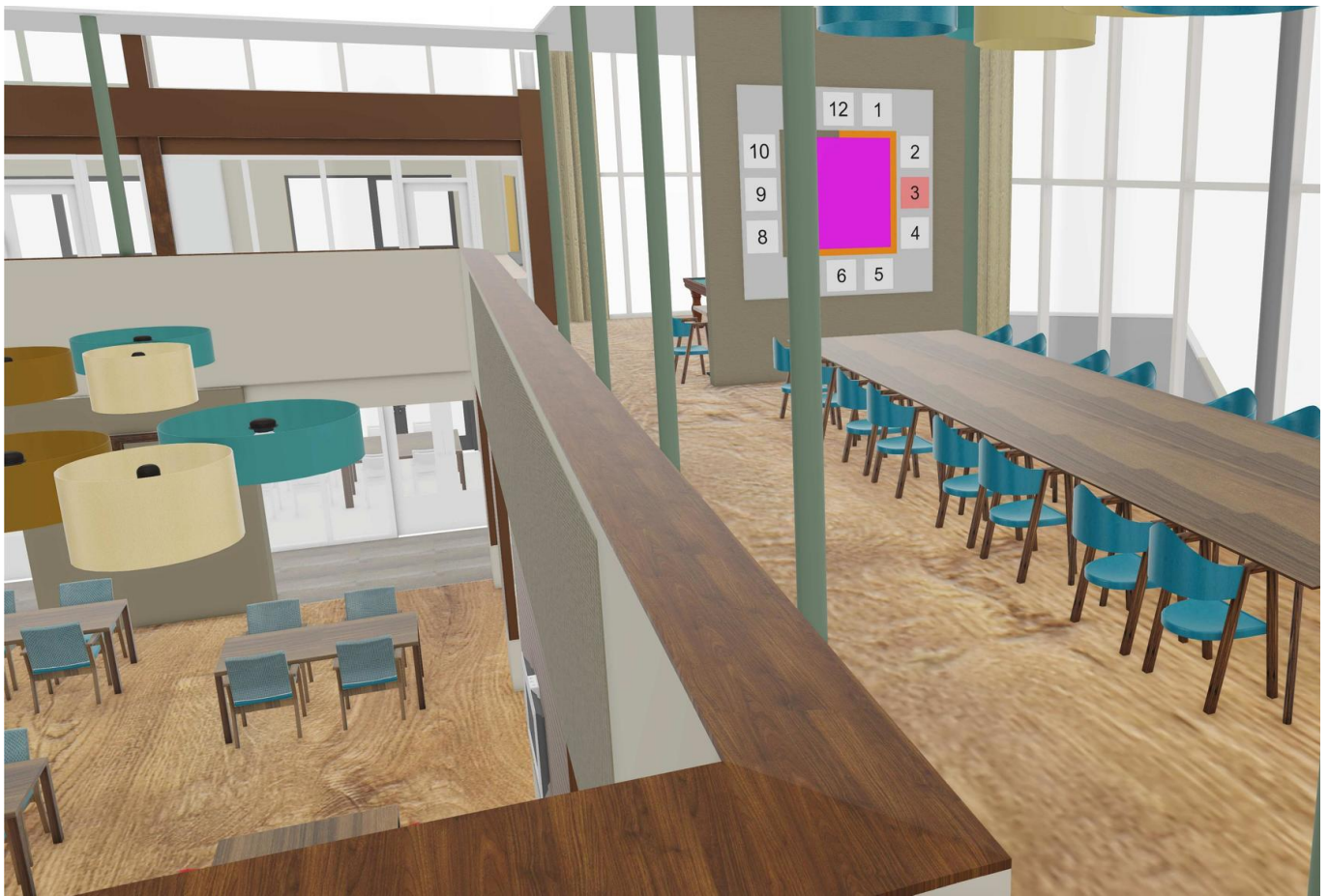
U krijgt een indruk van de eerste etage met het biljart en de activiteitenruimte 'de Klok'.