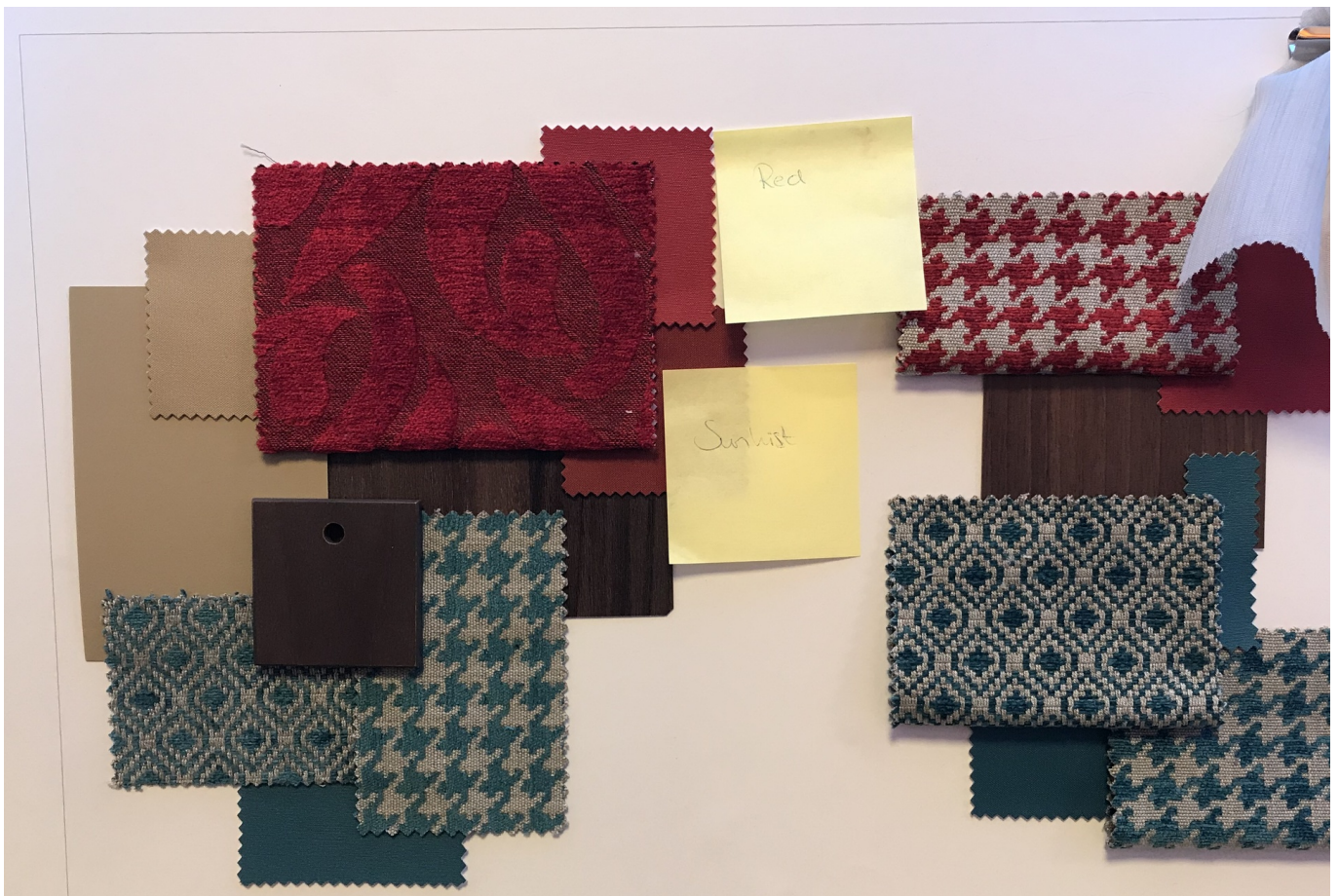
U ziet de gekozen stoffen voor het meubilair en de vloeren.